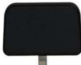
iMag Pro II

オーディオジャックまたは USB 装備のチップアンドシグネチャ方式リーダ。磁気ストライプとコンタクト EMV カード読取り