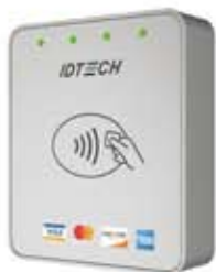
VP5300 NFC アンテナ

暗号化 PIN 入力が求められる、屋外無人 POS 操作向け PCI 4.x 認証 PIN 入力デバイス