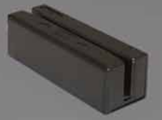
SecureMag 暗号化磁気ストライプリーダー