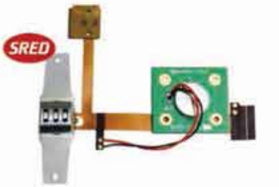
SREDHead PCI-PTS SRED ヘッドアセンブリ