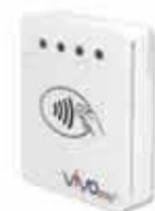
ViVOpay 4800 EMV コンタクト/ コンタクトレス/ 磁気ストライプリーダー