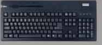
VersaKey POS キーボード コンパクトでプログラム可能/ 暗号化オプション