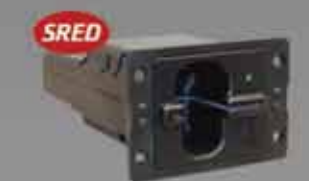
Spectrum Pro PCI 認証磁気ストライプ/ スマートカードインサートリーダー EMV チップ/PIN ソリューション