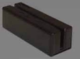
MiniMag 高性能磁気ストライプリーダー