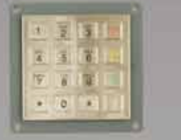
SmarPIN K100 PCI 認証モジュラー PIN 入力 デバイス キオスク端末向けキー配列