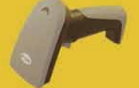
BluScan 超ロングレンジワイヤレス CCD バーコードスキャナ