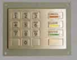
SmarPIN B100 PCI 認証モジュラー PIN 入力 デバイス 銀行業務向けキー配列