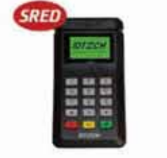
BTPay 200 磁気ストライプ/EMV リーダー & PIN パッド (Bluetooth/USB)