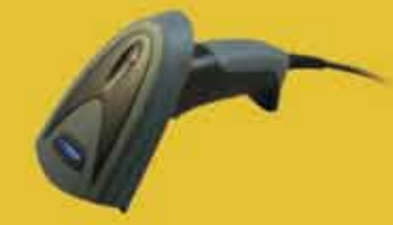
2DScan 2D CMOS バーコードイメージャ