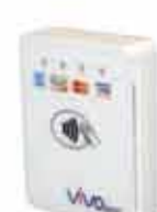
ViVOpay 4800E EMV コンタクト/ コンタクトレスリーダー