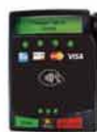
ViVOpay Vendi コンタクトレス NFC/ 磁気ストライプ EMV ペイメントデバイス