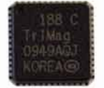
TriMag IV Chip PCI SRED 3 トラック マイクロプロセッサ/暗号化 エンジン付き デコード ASIC