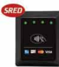
ViVOpay Kiosk III コンタクトレス NFC/ EMV リーダー