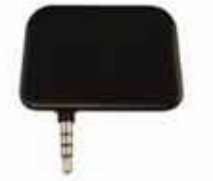
UniMag II Visa Ready 認証 2トラック磁気 ストライプリーダー (ヘッドホンジャック)