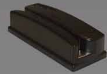
Omni 磁気ストライプ/バーコード用 ヘビーデューティ仕様スワイプ リーダー