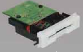
Gaming Reader バーチャルインサートリーダー