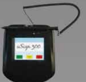
uSign 300 カラー LCD 付き サイン入力デバイス