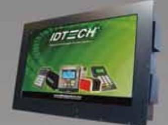
Zeus All-In-One 21.5 インチ屋外向けタッチ スクリーンコンピュータ