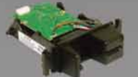
Dual Head MOIR デュアルヘッド磁気ストライプ 専用インサートリーダー (MOIR)