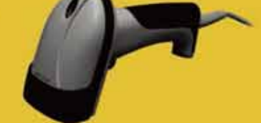
VersaScan III ロングレンジ CCD バーコードスキャナ