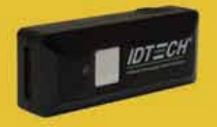
BTScan ワイヤレス CMOS バーコードイメージャ