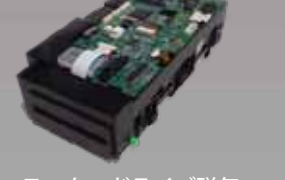
モータードライブ磁気 カードリーダー モータードライブ式の 磁気カードリーダー