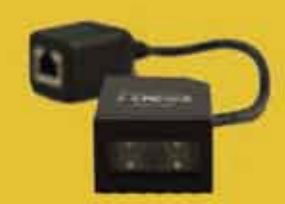
2DScan FX100 固定マウント 2D CMOS バーコードイメージャ