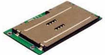
MiniSmart II 高性能 EMV level 1/2 対応 カードリーダー