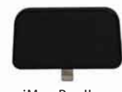
iMag Pro II Apple iOS デバイス向け 磁気ストライプリーダー (Lightning コネクタ)