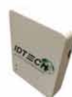
ViVOpay 4800C EMV コンタクトレスリーダー