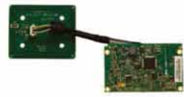
ViVOpay OEM ボードセット OEM コンタクトレスモジュール