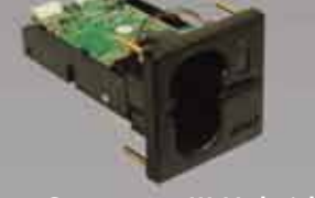
Spectrum III Hybrid ハイブリッド磁気ストライプ/ EMV インサートリーダー