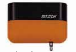
Shuttle Visa Ready 認証 2トラック磁気 ストライプリーダー (ヘッドホンジャック)