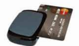
BTMag 磁気ストライプリーダー (Bluetooth/USB)