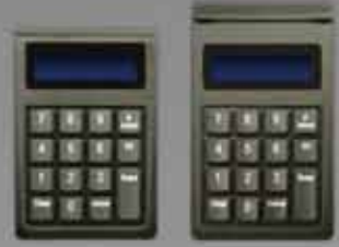
SecureKey M シリーズ 光学的暗号化磁気ストライプ リーダー付き 暗号化キーパッド