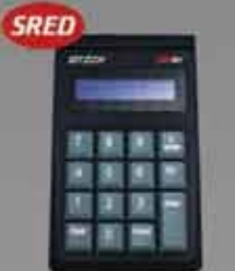
SREDKey 暗号化磁気ストライプ リーダー付き PCI 認証キーパッド