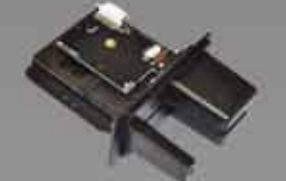
Spectrum Air 屋外向けインサートリーダー