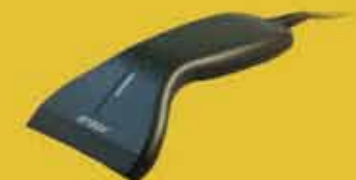
EconoScan II ショートレンジ CCD バーコードスキャナ