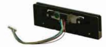
SecureHead w/Rail 磁気ストライプ用暗号化 OEM リーダーモジュール