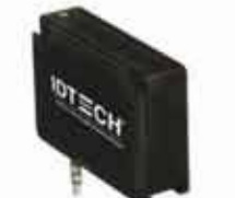
UniPay/Unipay 1.5 Visa Ready 認証 磁気ストライプ/ EMV リーダー *Unipay 1.5 はリーダー内 で EMV L2 対応 (ヘッドホンジャック /USB)