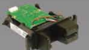
Spectrum III 磁気ストライプ専用 インサートリーダー (MOIR)