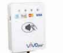
UniPay III 磁気ストライプ /EMV/コンタク トレスリーダー (ヘッドホン ジャック/USB)