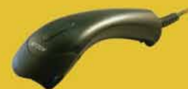
ValueScan II ミッドレンジ CCD バーコードスキャナ