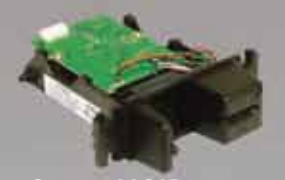
SecureMOIR 暗号化磁気ストライプ専用 インサートリーダー (MOIR)