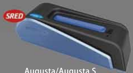
Augusta/Augusta S PCI-PTS EMV/磁気ストライプ リーダー *Augusta S は SRED 対応