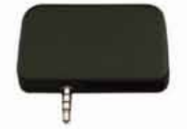
UniMag Pro 3トラック磁気ストライプ リーダー (ヘッドホンジャック)