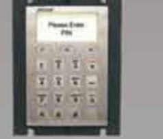
SmarPIN L100 PCI 認証モジュラー PIN 入力 デバイス LCD 付き *Spectrum Pro と統合